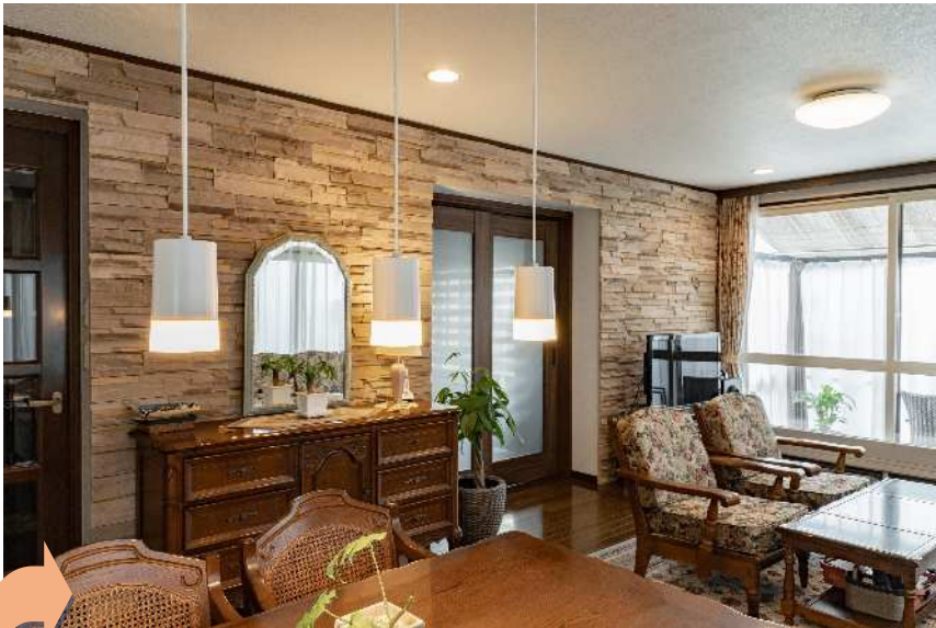
リビングの一面にタイルを貼ると、非日常的な雰囲気になりました。

お子様が独立し、ご夫婦だけで自宅で過ごす時間をより快適にしたいとのご相談を頂きました。